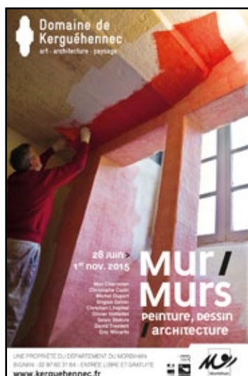
Exposition en cours Mur/Murs. Peinture, dessin/architecture