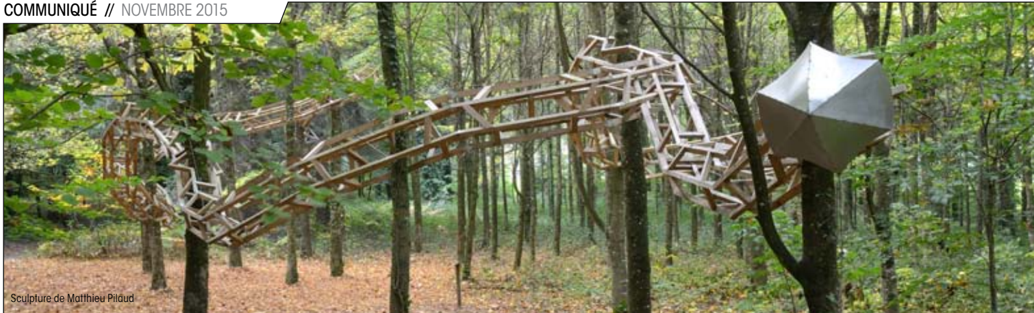
Sculpture de Matthieu Pilaud