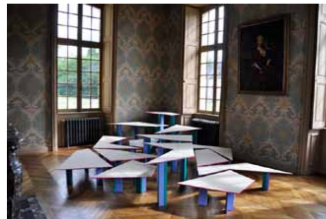
C'est comme si..., 2012