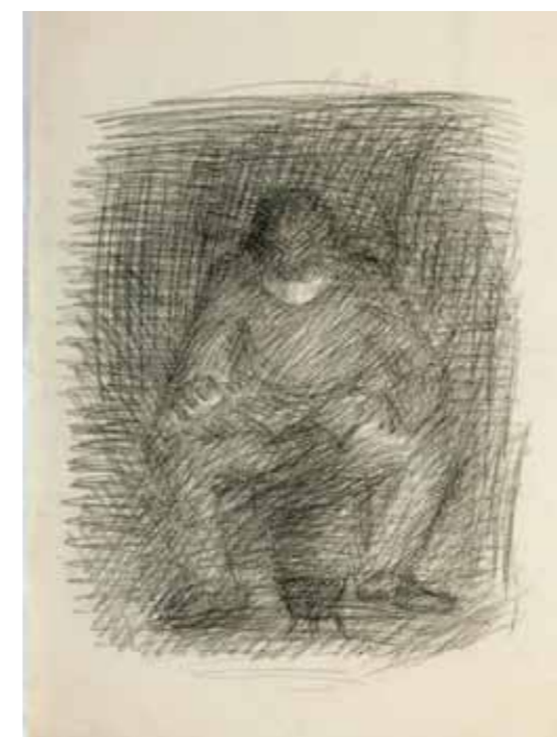
Le Brasero, 1926.