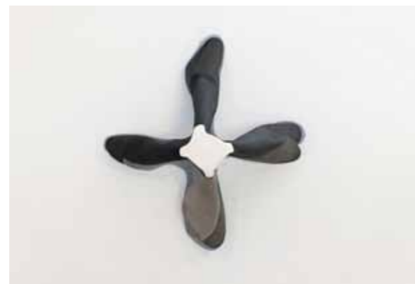
Étoile blanche, 2011