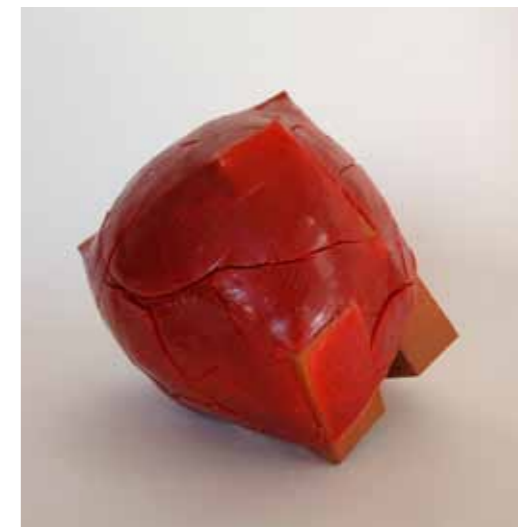
Résine craquée , polyester et brique, 2010