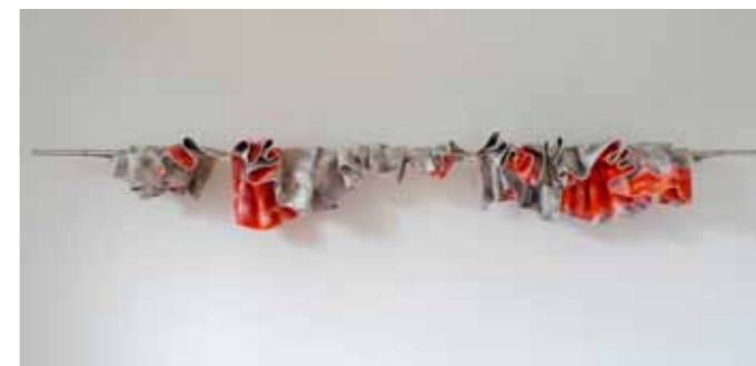
Accumulation de cinq peintures sur barre, 2013