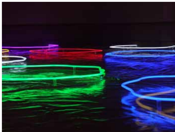
Sans titre, 2013