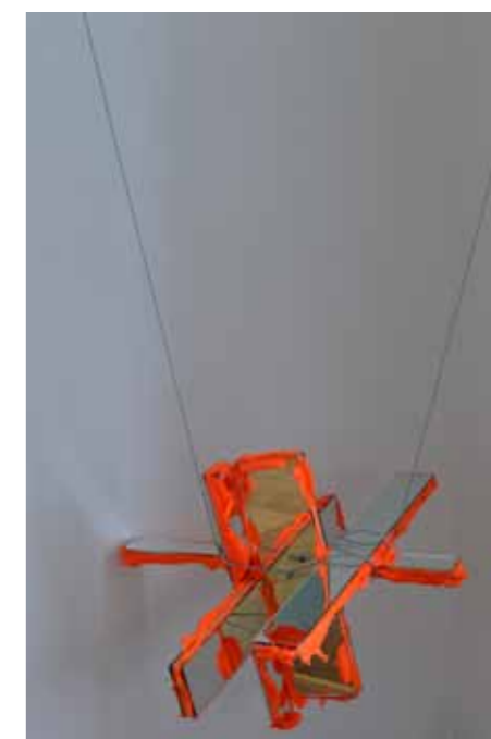
ACDC, etc., 2012