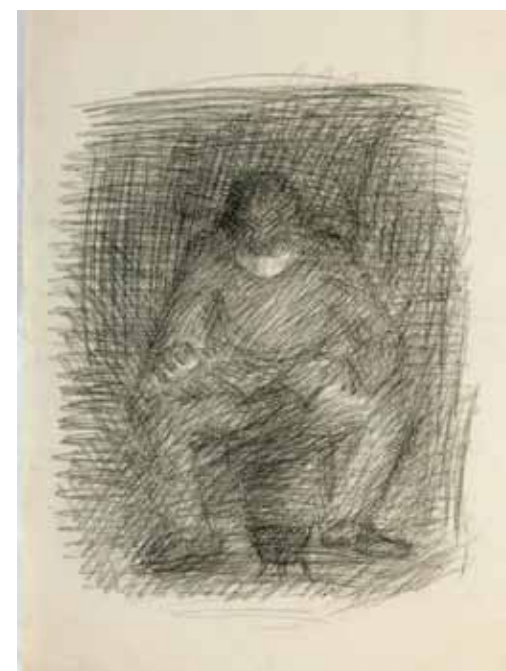
Le Brasero, 1926.