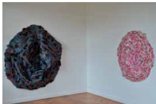
Sans titre, 2005 et Monoprix 1, 2004

Claude Briand-Picard, héritier de l'abstraction des années 70, présente des œuvres aux qualités visuelles proches de la peinture abstraite où le recouvrement traditionnel est abandonné au profit de matériaux industriels ou domestiques.