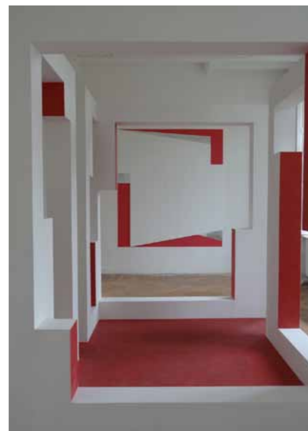
Pièce structurée évidée 13-3 TER PV SUP.13-3

Né en 1942 à Castres, Bernard Cousinier vit et travaille à Saint-Maur-des-Fossés. Il suit des études à l'École nationale supérieure des Beaux-arts de Paris jusqu'en 1972. Dès le début de sa pratique, la problématique du tableau en tant que rectangle à peindre l'interpelle. Pour échapper à cette géométrie, il se met à découper des châssis. Mais une vingtaine d'années plus tard, dans les années 90, c'est d'une toute autre façon qu'il aborde cette problématique. L'artiste prête alors une grande attention aux formes bien spécifiques traitées de manière géométrique et à l'aplatissement de couleur. Quand il intervient dans une architecture, il associe son projet aux volumes et aux formes du lieu qui l'accueille. Présentée dans un premier temps à la galerie Pixi à Paris, l'œuvre de Bernard Cousinier était flanquée contre un mur. À Kerguéhennec, le volume, complètement évidé, est placé au centre de la salle permettant ainsi au regard de circuler autour et au travers.