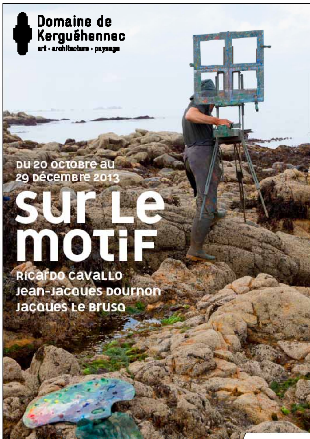
Concepteur: David Noel